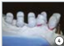
4 ...la conception d'une armature parfaite