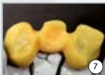
7 idéal pour la céramique pressée et la CAD et CAM