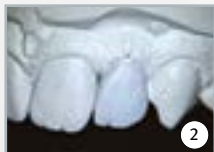
2 wax-up pour couronne d'implant