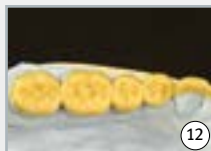
12 wax-up diagnostique