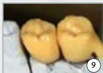
9 d'abord tout contrôler...