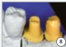
8 piliers d'implants déjà fraisés