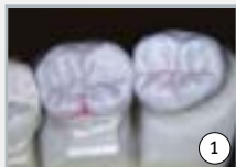
1 surfaces occlusales anatomiques en cire