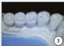
3 un modelage 100% anatomique conduit à...