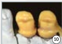
10 ... ensuite réduire de 1.5 mm