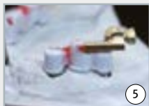
5 construction des barres primaires