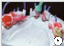
6 construction des barres secondaires