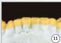
11 présentation de l'esthétique au patient